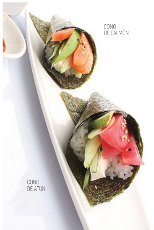
CONO DE ATÚN