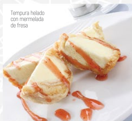
Tempura helado con mermelada de fresa